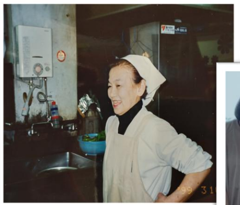
お弁当屋さんの頃