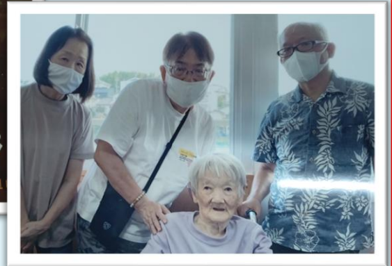
ご家族様と一緒にパチリ