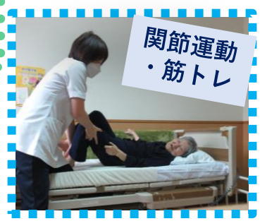
関節運動 ・筋トレ