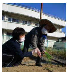
デイサービスの風景 (玉葱植え)