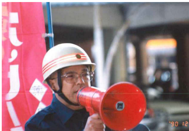
消防士時代の様子