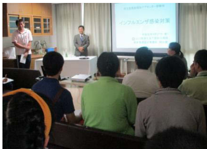
感染対策訪問ラウンド及び研修