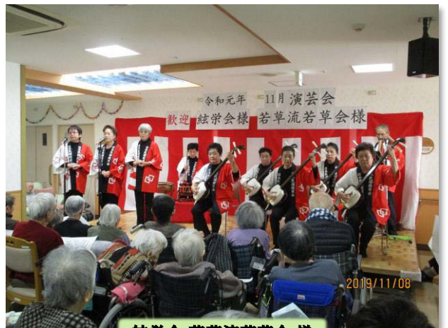
絃楽会 若草流若草会 様