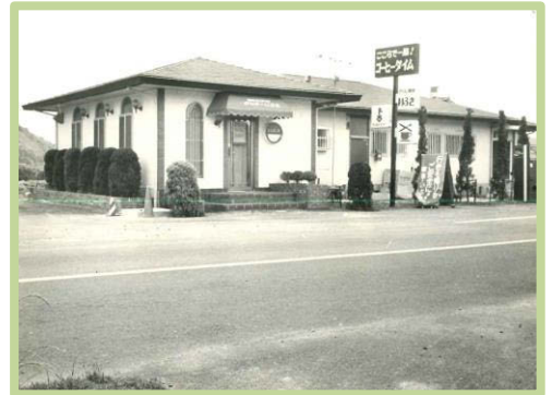
オープンした頃の喫茶店