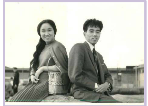
ご夫婦で記念撮影