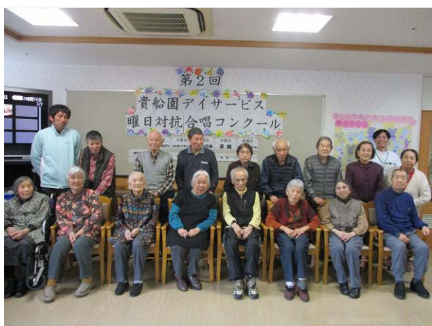
火曜日チームの皆さん