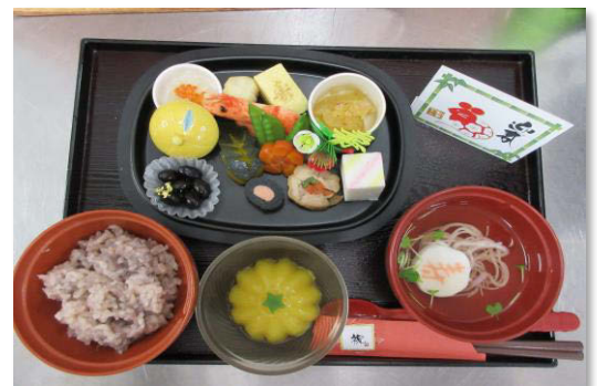
正月メニュー刻み食