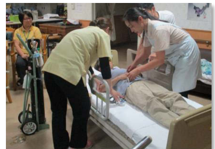
緊急時シュミレーション研修