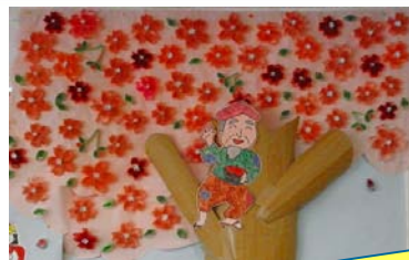
デイサービスの壁画