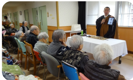
ありがた〜い法話を聞きました